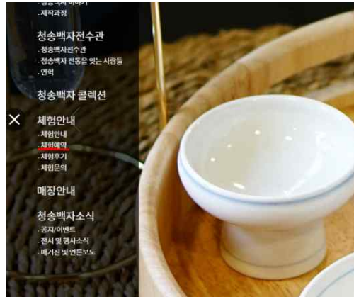
2. 왼쪽 탭 (체험예약)클릭