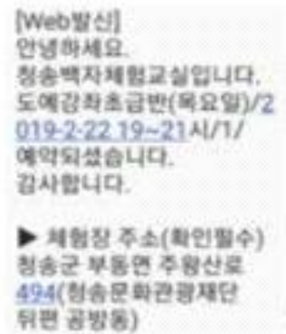
5. 도예강좌 신청 확인(문자발송)