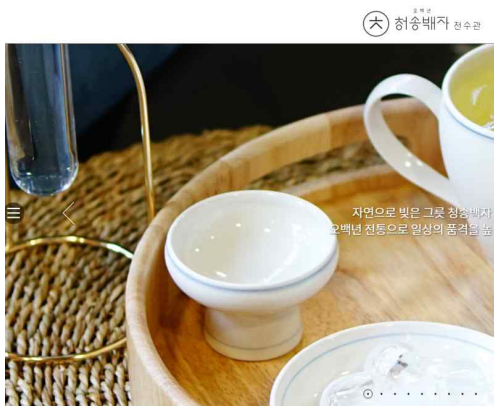
1. 청송백자전수관 홈페이지 접속 http://www.csbaekja.kr/main/